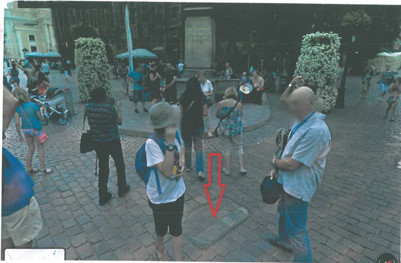
Zal. nr 2